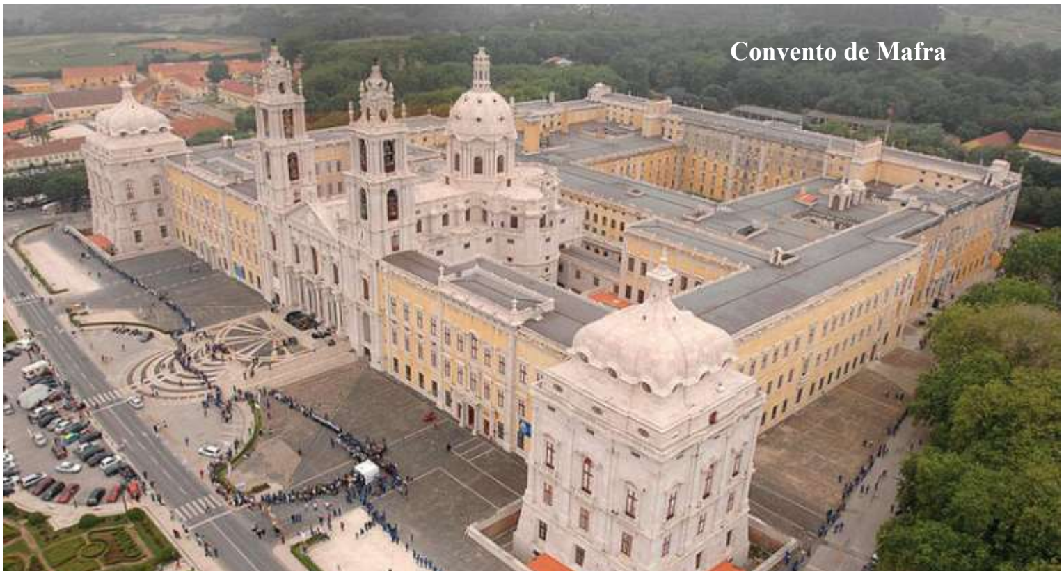
Convento de Mafra

- Reagendado para dia 10 novembro de 2020 -