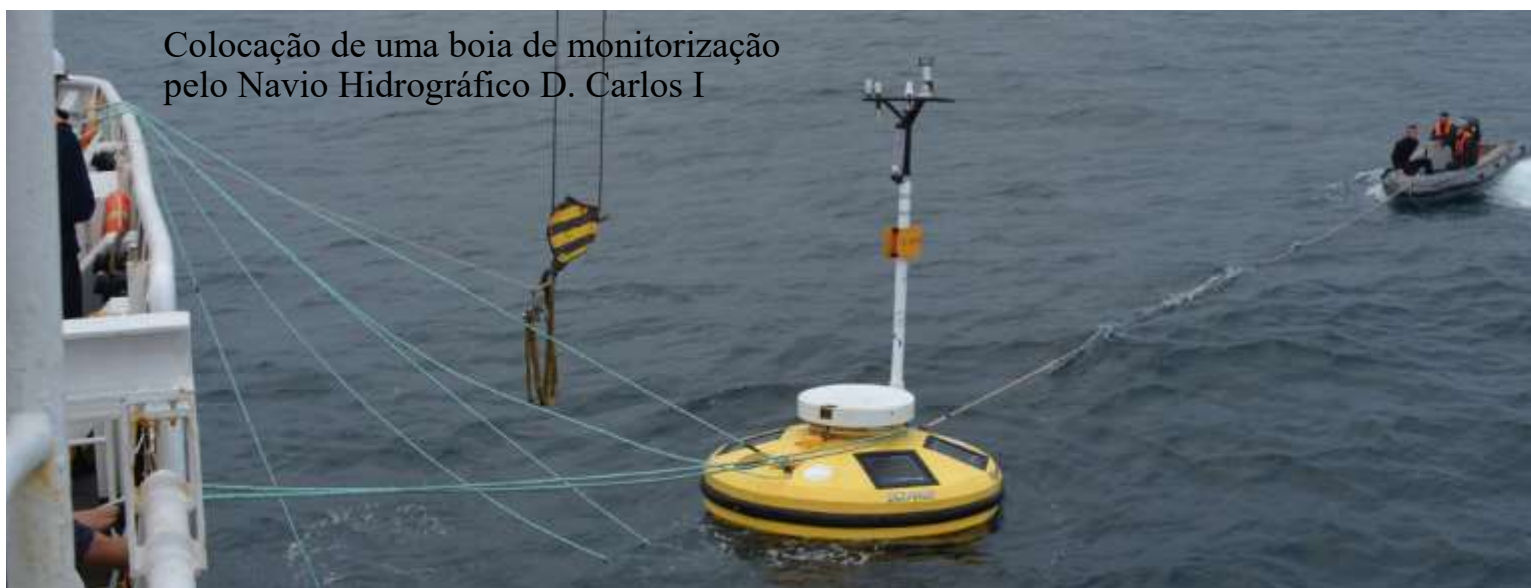
Colocação de uma boia de monitorização pelo Navio Hidrográfico D. Carlos I