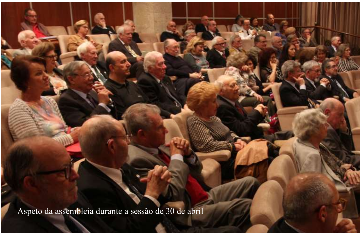
Aspetto da assembleia durante a sessão de 30 de abril