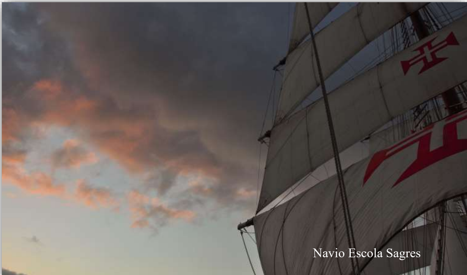
Navio Escola Sagres