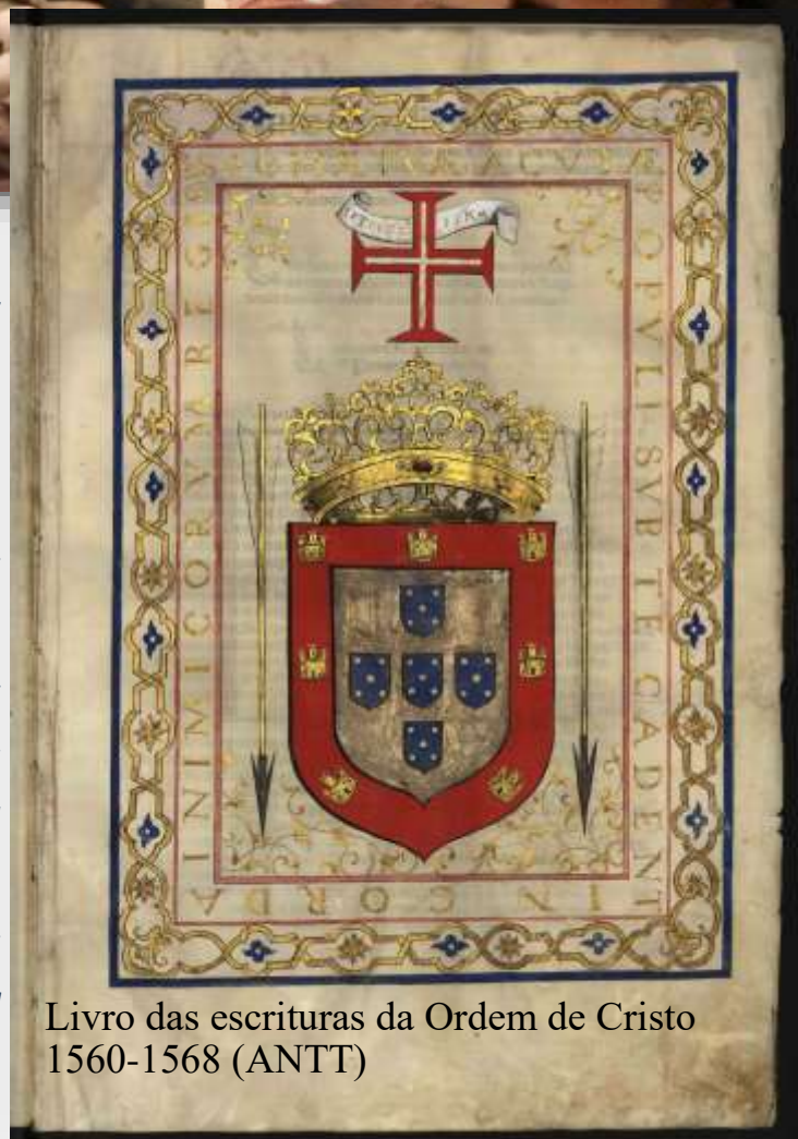
Livro das escrituras da Ordem de Cristo 1560-1568

Para o conferencista, “o processo de transição para as modernas ordens de mérito foi gradual, influenciado pelos ventos de mudança sociopolítica ocorridos na Europa, por força da Revolução Francesa, e que determinariam o fim do Antigo Regime em Portugal, nomeadamente com as Invasões Francesas, a Revolução Liberal, a subsequente Guerra Civil (1826-34) e a implantação da monarquia liberal” .